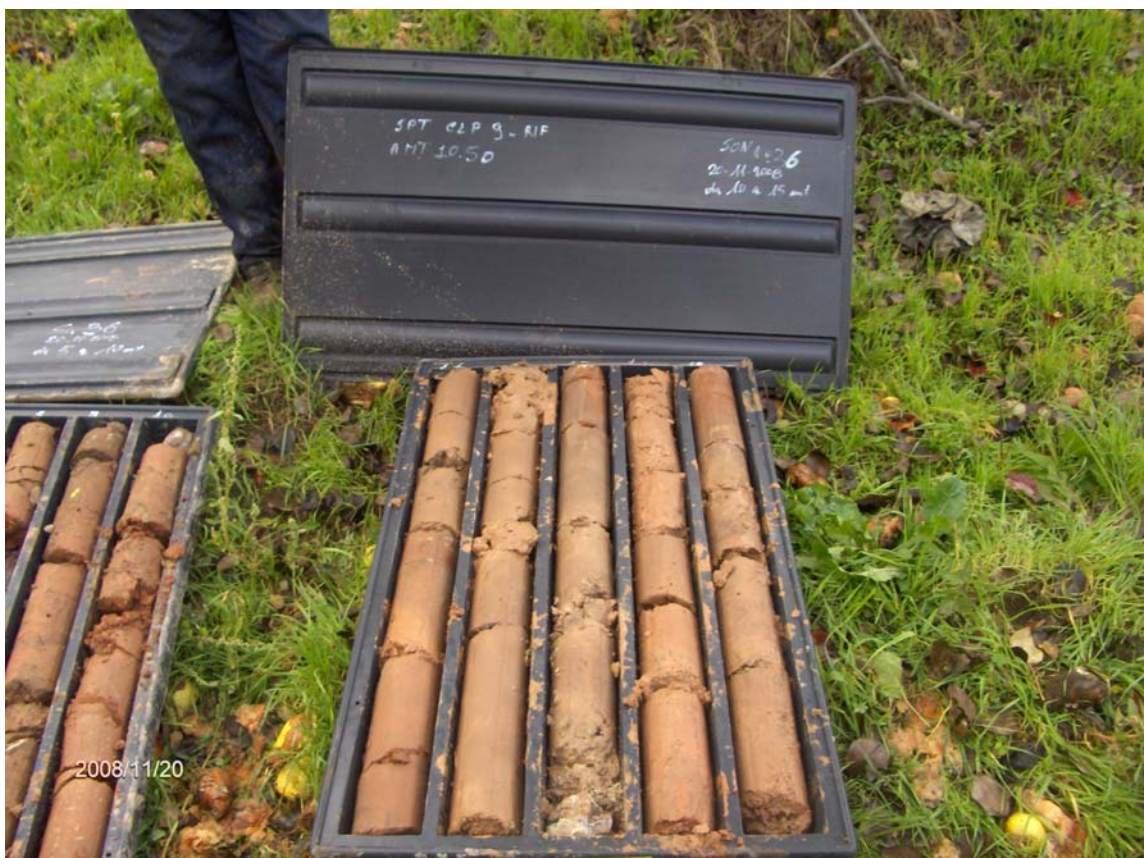
Figura 4: cassette catalogatrici del sondaggio S36