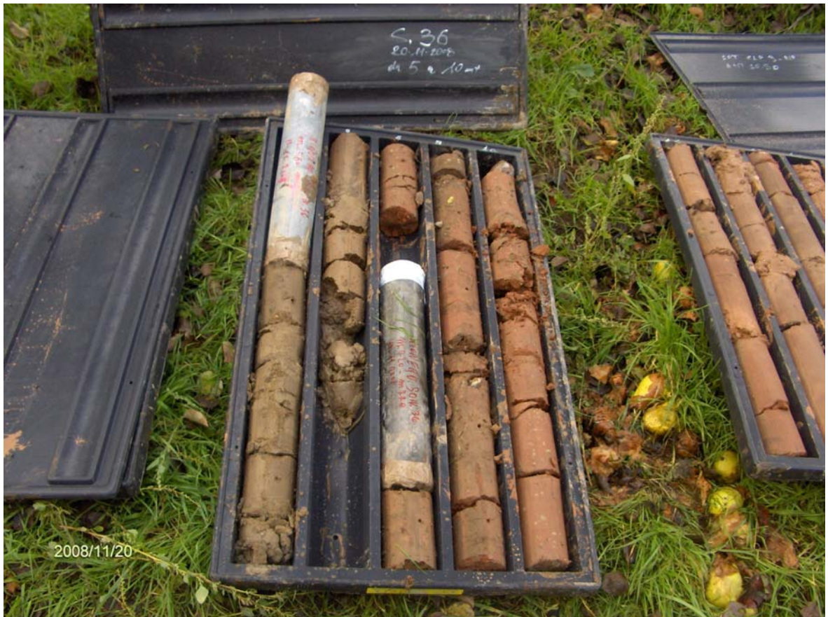
Figura 3: Cassette catalogatrici del sondaggio S36