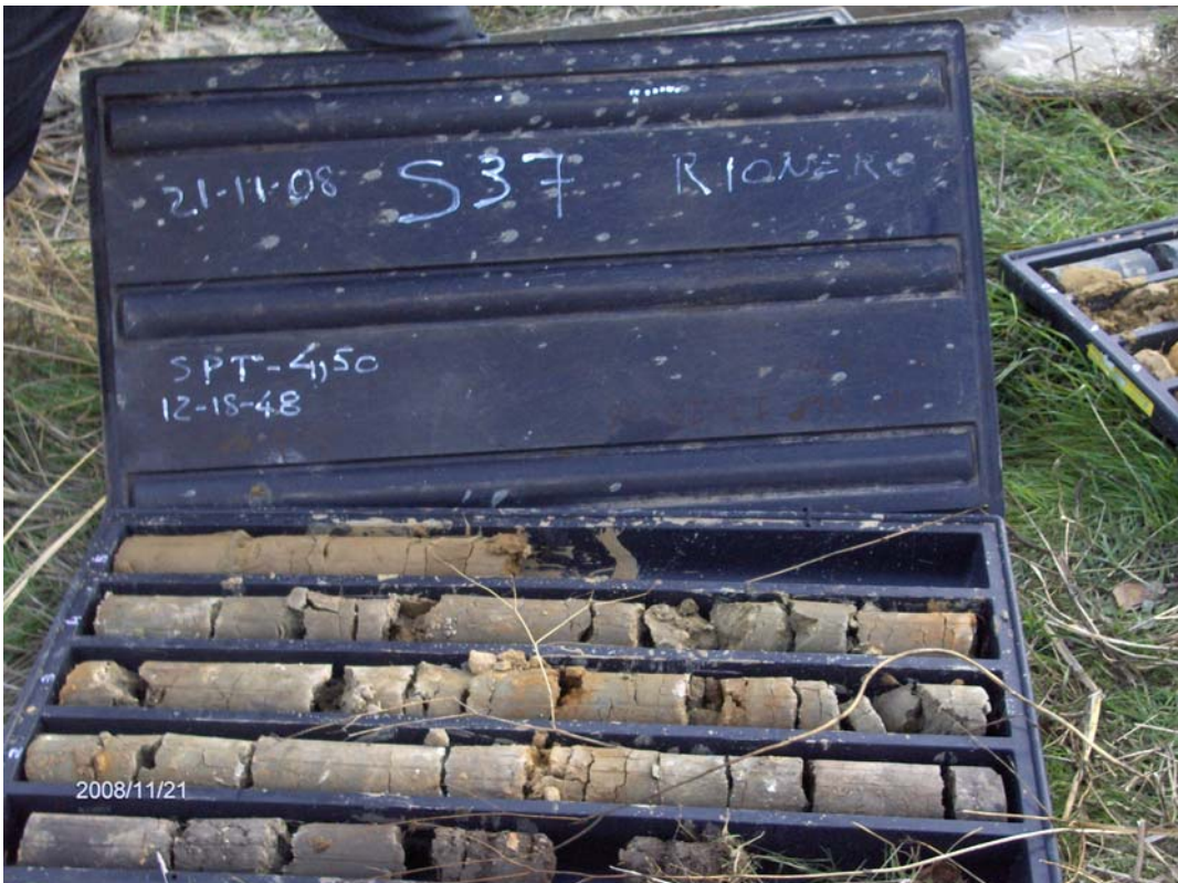
Figura 6: cassette catalogatrici del sondaggio S37