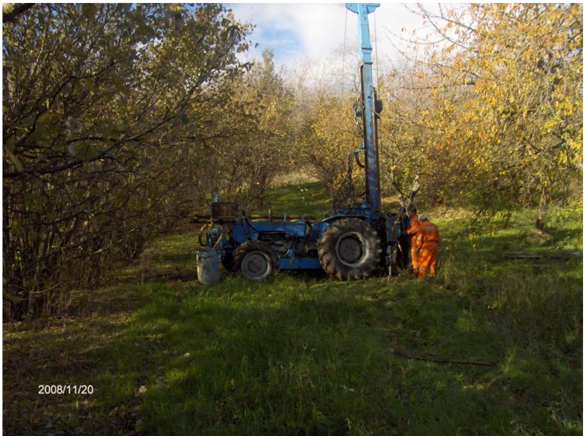
Figura 2: Esecuzione del Sondaggio S36