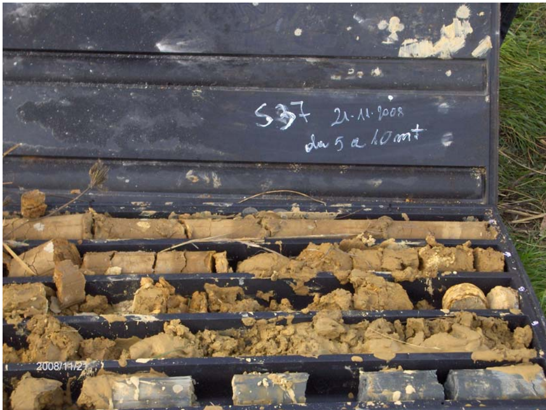
Figura 7: cassette catalogatrici del sondaggio S37