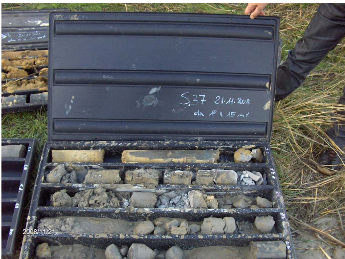
Figura 8: Cassette catalogatrici del sondaggio S37