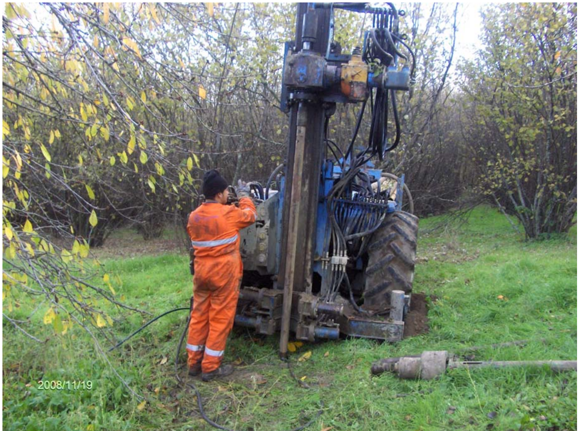
Figura 1: Esecuzione del sondaggio S36