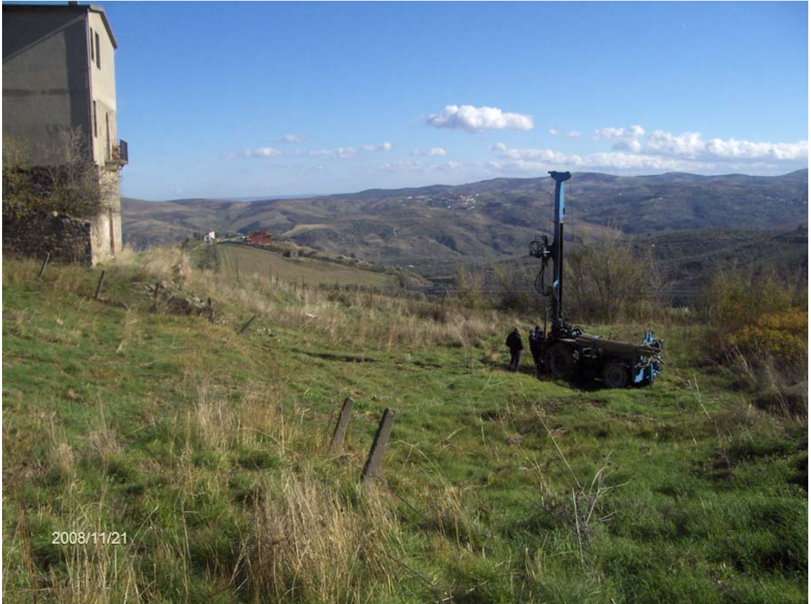
Figura 5: cassette catalogatrici del sondaggio S37